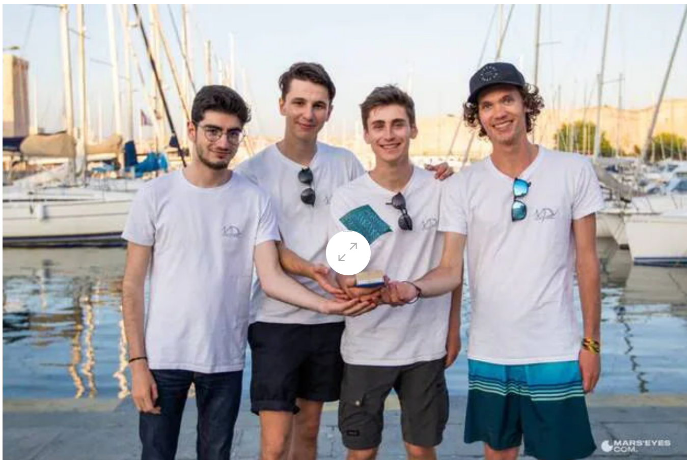
À l'éco-régate, l'équipage MDV-Centrale Méditerranée, vainqueur du trophée spécial du jury récompensant l'équipage avec le meilleur coefficient écologique.