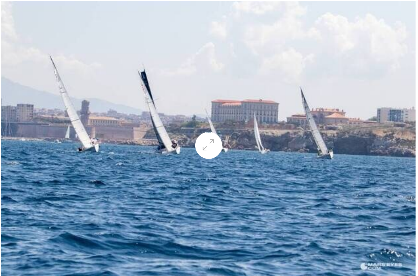
Des bateaux en éco-régate, à Marseille le 27 mars 2023.